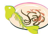
Restes de repas (même ceux de viande et de poisson)