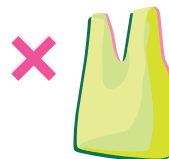
Pas de sacs ni de vaisselles biodégradables