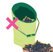
Pas de cendres