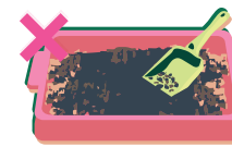
Pas de litières d'animaux