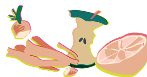
Épluchures de fruits et légumes