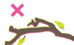
Pas de gros branchages